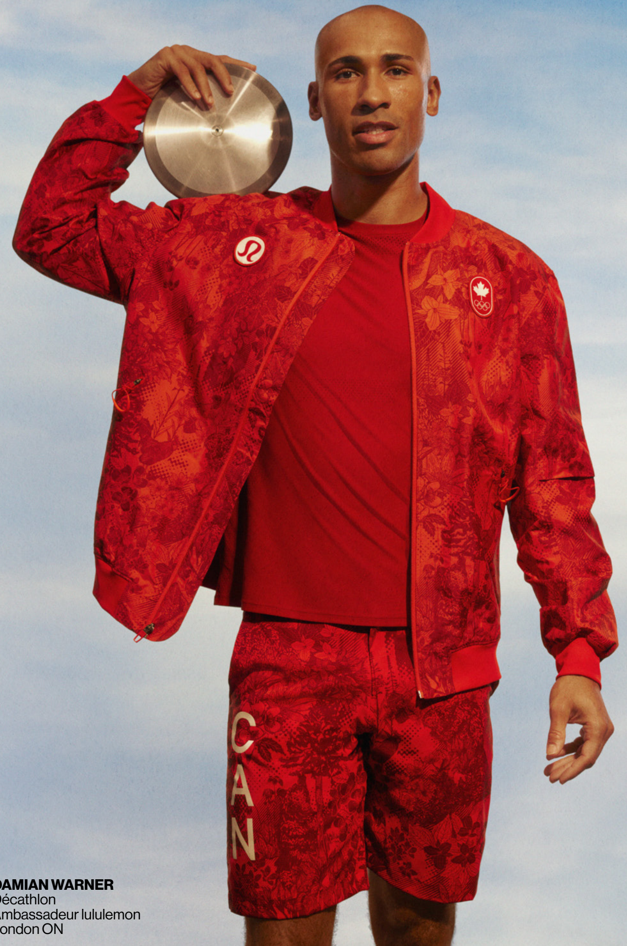
DAMIAN WARNER Décathlon Ambassadeur lululemon London ON