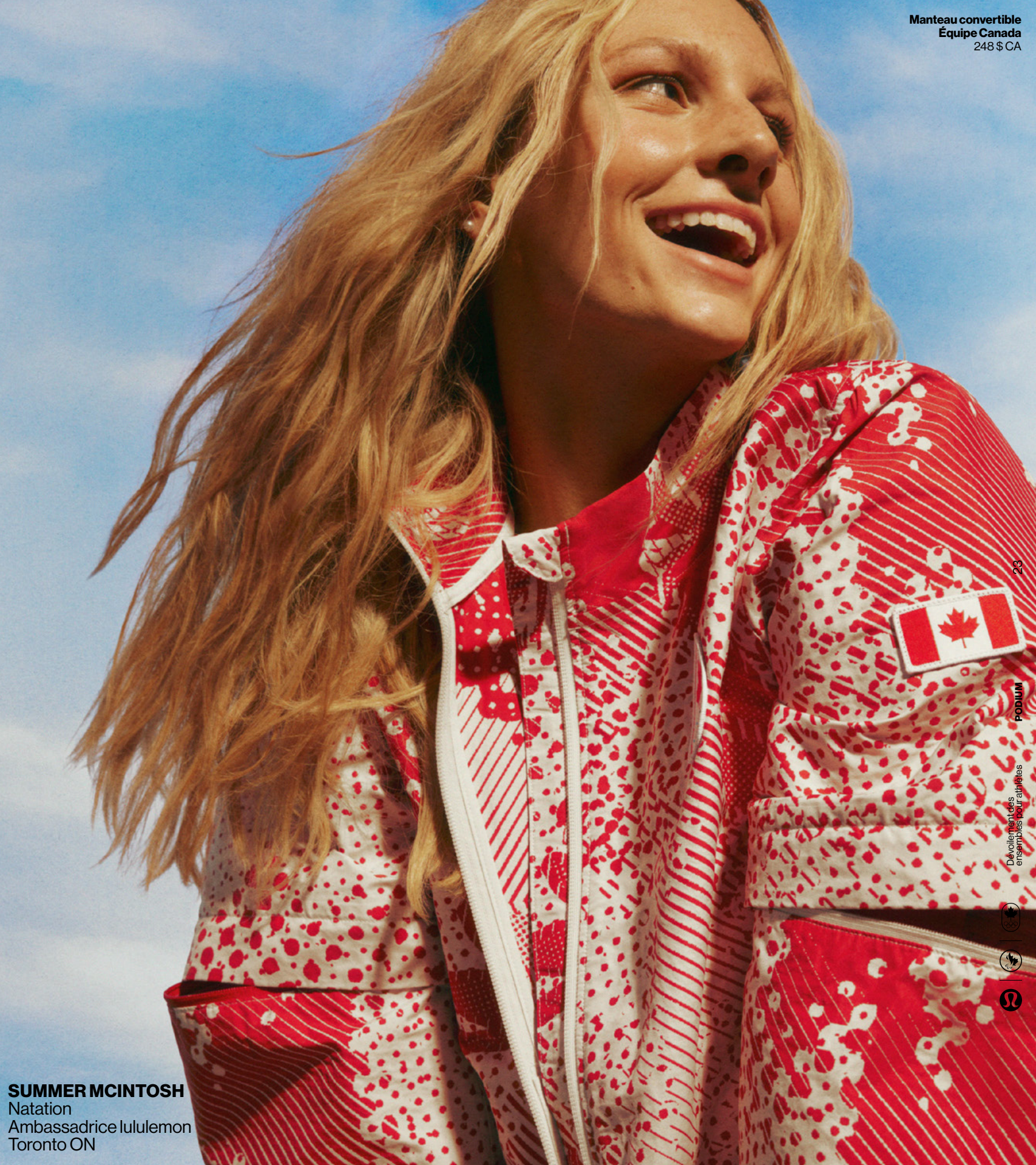
SUMMER MCINTOSH Natation Ambassadrice lululemon Toronto ON