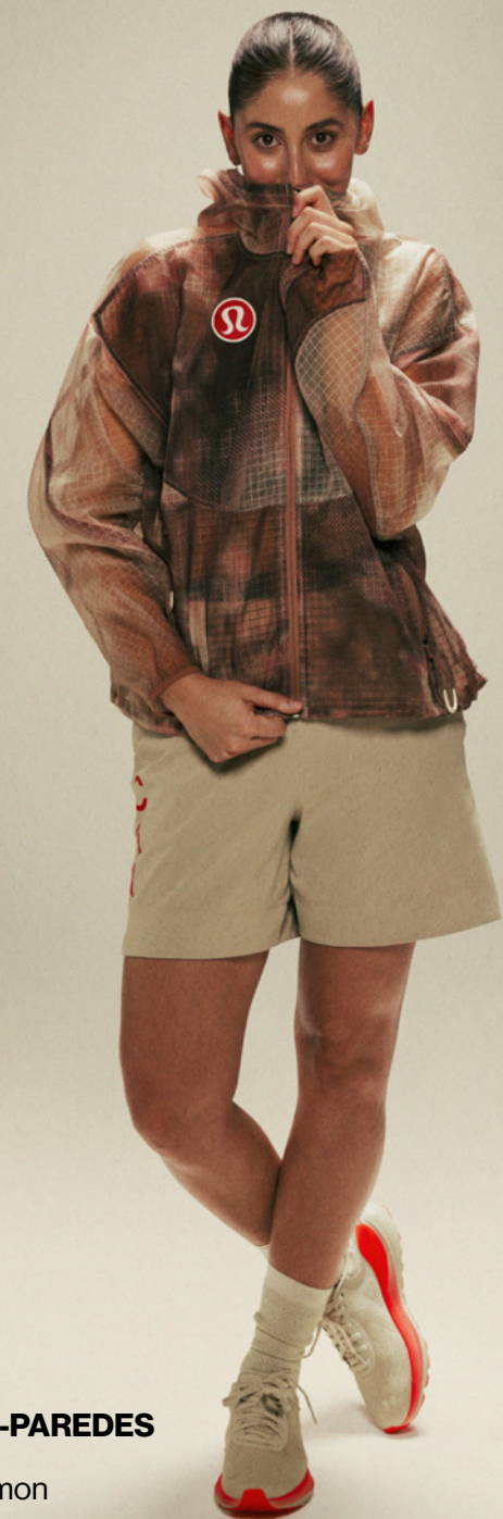
MELISSA HUMANA-PAREDES Volleyball de plage Ambassadrice lululemon Toronto ON