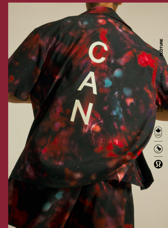
CHEMISE BOUTONNÉE ÉQUIPE CANADA 98 $ CA