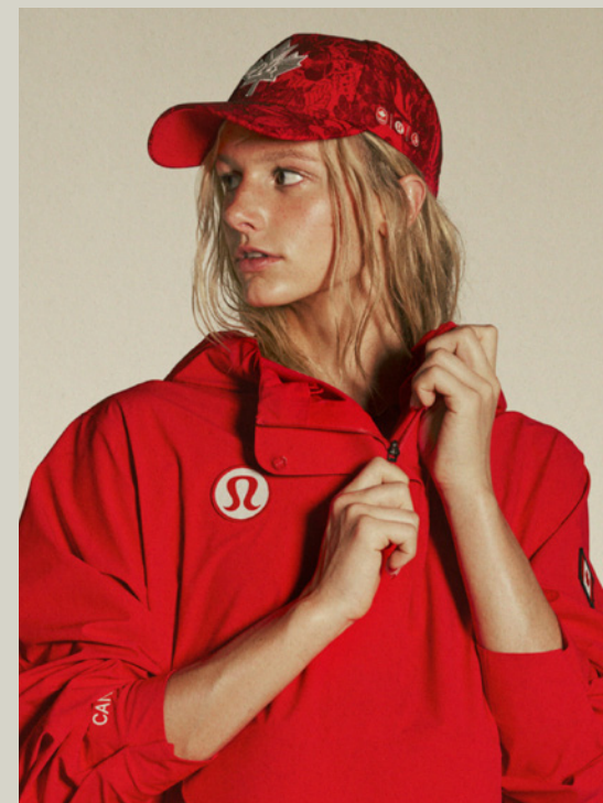
SUMMER MCINTOSH Natation Ambassadrice lululemon Toronto ON