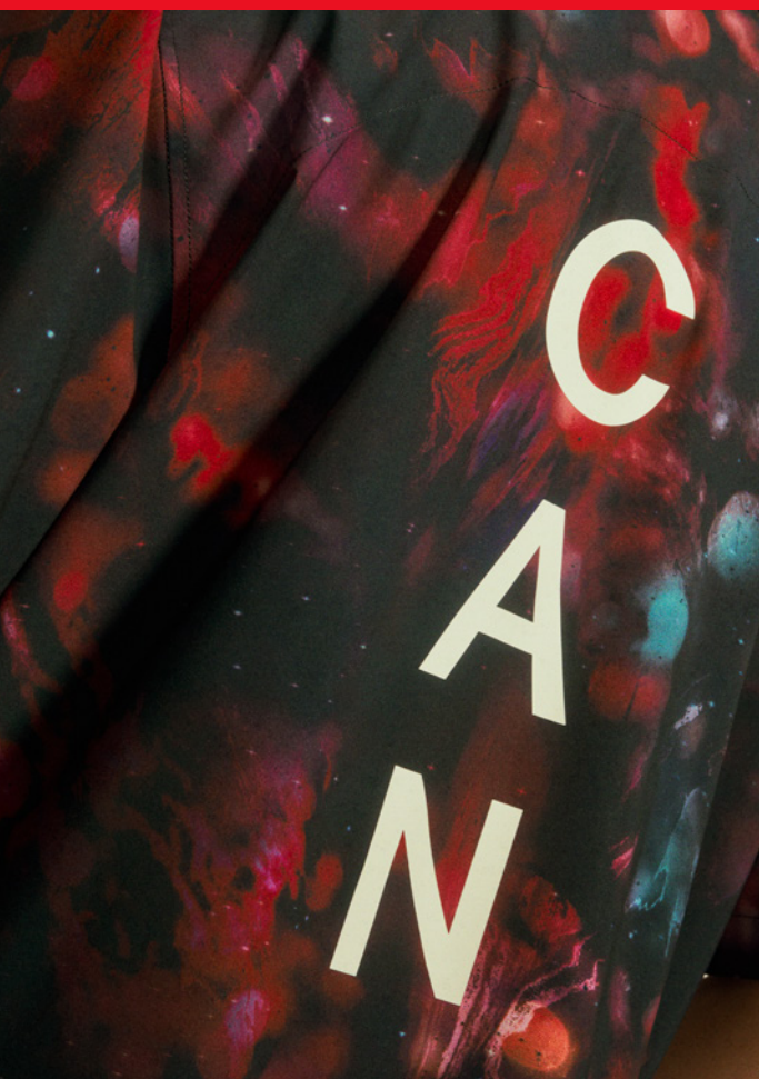
ZAK MADELL Rugby en fauteuil roulant Ambassadeur lululemon Okotoks AB

« Ce que je retiens le plus de ma participation au processus, c'est l'attention sincère portée à la recherche de solutions accessibles et adaptatives pour développer l'ensemble final. Je ne pouvais imaginer une meilleure façon de procéder. »